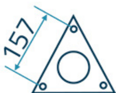
maszt / mast 5-12m