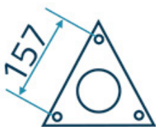
maszt / mast 5-12m