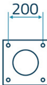
maszt / mast 13-18m