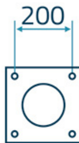
maszt / mast 13-18m