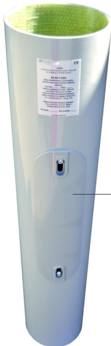
Drzwiczki rewizyjne (PC + ABS)

UWAGA: Zdjęcie poglądowe dla całej rodziny produktów.