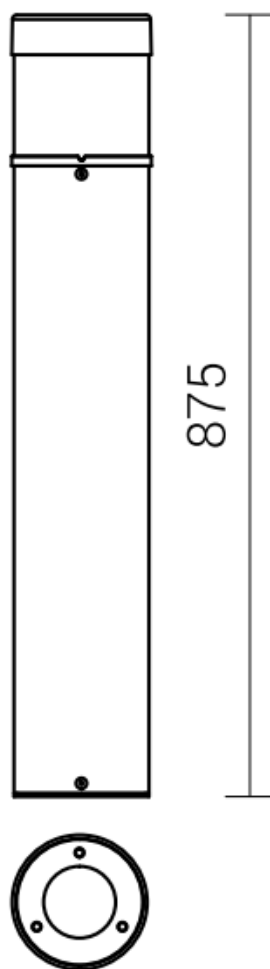
KARIN 900 LED

UWAGA: Zdjęcie poglądowe dla całej rodziny produktów.