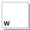
W – zimny biały • bílé studené • bílé studené WW – ciepły biały • bílé teplé • bílé teplé