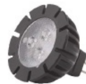
Mr16 LED 12V 3W GU5.3 Art. Nr. 6193011